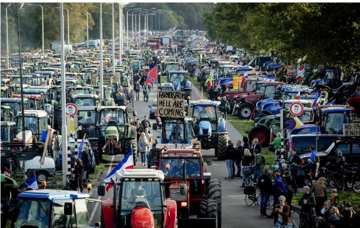
Figuur 1 3.500 trekkers op weg naar Stroe (22 juni 2022)

Daarentegen werd veel landbouwgrond in de VS opgekocht door miljardairs en zelfs door China! Zo bezat Bill Gates in juli 2022 een areaal van zo'n 270.000 acres oftewel 108.000 hectare aan landbouwgrond in de VS 2 .