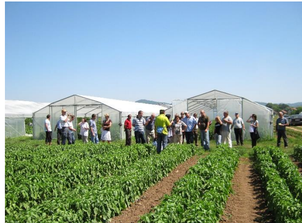
Figuur 6 Demodag bij AgriSan kassencomplex

Nadat er een eind was gekomen aan directe betrokkenheid van Agrinas in Bosnië is de door Agrinas opgezette coöperatie AgriSan doorgegaan met de activiteiten, geleid door twee voormalige Bosnische medewerkers van Agrinas. Ook de door Agrinas opgerichte organisaties van melkveehouders (SLUP) en groentetelers (Povrtlar) hebben hun activiteiten voort-gezet in de provincie Sanski Most.