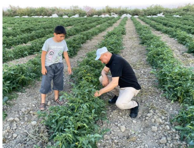
Figuur 5 Groenteteelt Kazahstan

Ook werden groentetelers geholpen met de aankoop van hoogwaardige zaden en kunstmest door het contact met agenten van Nederlandse zaadb企业n. Dit vanwege het feit dat vanuit Oezbekistan en Kirgizië veel minderwaardige zaden op de markt worden gebracht.