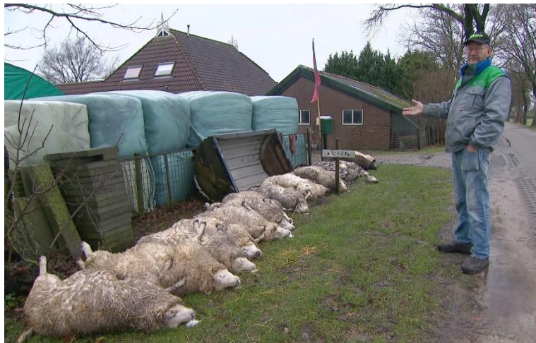
Figuur 2 Door wolven gedode schapen, Friesland, januari 2023

Nog een ander fenomeen dat duidelijk gericht is tegen de boerenstand is het EU project genaamd ‘Rewilding’. Dit plan beoogt zo’n 30% van de cultuurgrond binnen de EU ‘terug te geven aan de natuur’... In dit kader past ook de terugkomst van de wolf naar Nederland. De bevolking werd wijsgemaakt dat de wolf op eigen houtje