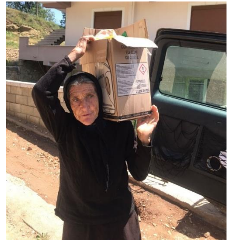
Figuur 4 Vrouw met hulppakket

Omdat voorlopig geen grootschalige activiteiten zullen worden opgezet op het gebied van landbouwontwikkeling is besloten om in verband met de relatief hoge standaardkosten voor het onderhoud van stichtingen in Albanië stichting ELIAH voorlopig slapend te maken. Alle activiteiten vallen voorlopig onder het ontwikkelingsprogramma Mokra Berggebied in samenwerking met de Apostolische Kerk in Pogradec.