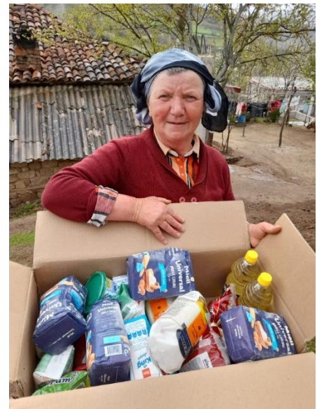
Figuur 3 Voedselhulp Albanië

Het door EO Metterdaad ondersteunde ouderenproject in het berggebied Mokra in Oost-Albanië verliep goed. Vanuit het project ontvangt een dertigtal ouderen regelmatige voedselhulp en er wordt kleinschalige hulp geboden op het gebied van voedselveiligheid, zoals het bouwen van eenvoudig te repliceren groentekassen, de levering van goed zaaigoed en andere kleinschalige initiatieven. Zo werden in 2023 opnieuw twee plastic tunnelkassen gebouwd en twee velden met wintertarwe ingezaaid. Ook ontvingen vijf arme gezinnen een tweetal hoogwaardige drachtige melkgeiten, waardoor tenminste gedurende de helft van het jaar voorzien wordt in melk en kaas, alsook inkomsten van de verkoop van jonge geitjes.